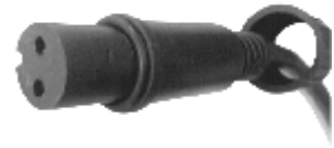
fig. 2. / Abbildung 2 / 2. ábra / obraz 2. / Figura 2. / 2. skica / 2. skica / obraz 2.