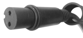
fig. 2. / 2. ábra / obraz 2. / Figura 2. / 2. skica / obraz 2.