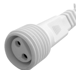
fig. 2. / 2. ábra / obraz 2. / Figura 2. / 2. skica / obraz 2.