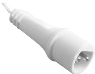
fig. 1. / 1. ábra / obraz 1. / Figura 1. / 1. skica / obraz 1.