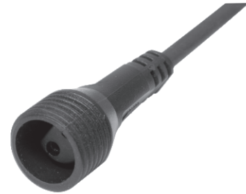
figure 2. • 2. ábra • 2. obraz • figura 2. • 2. skica • 2. obrázek • 2. slika